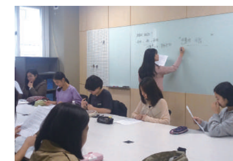
영재학급 문예창작과 수업 모습