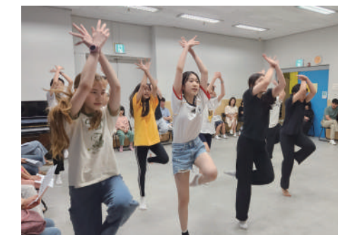
영재학급 연극영화과 수업 모습