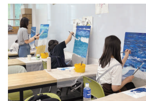
영재학급 미술과 수업 모습