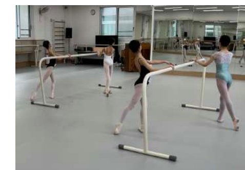
영재학급 무용과 수업 모습