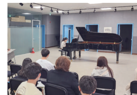
영재학급 음악과 수업 모습